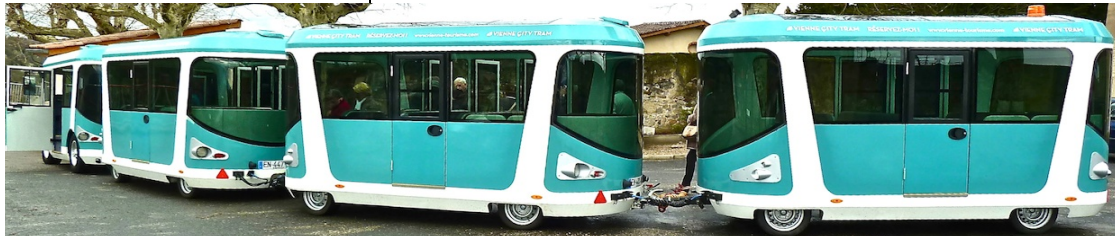
Le petit train de la ville de Vienne – Ad'Vienne que pourra