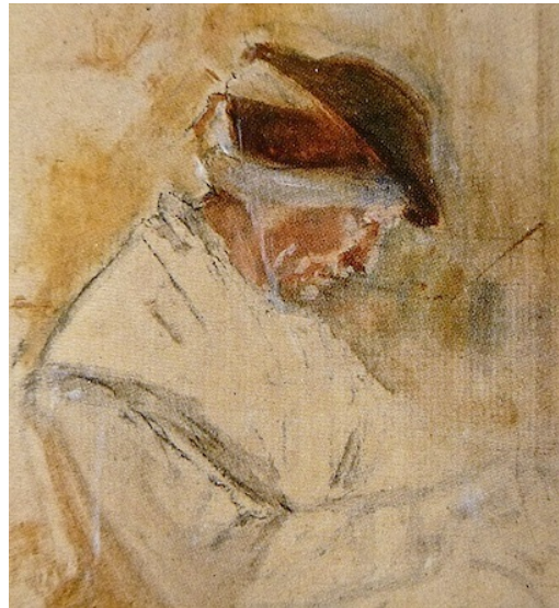
La dentelière – 1839 (vue partielle)