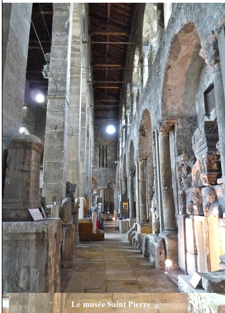
Le musée Saint Pierre

Les commissions et attributions des responsabilités sont portées sur le site du CGVVR, http://www.cgvvr.org