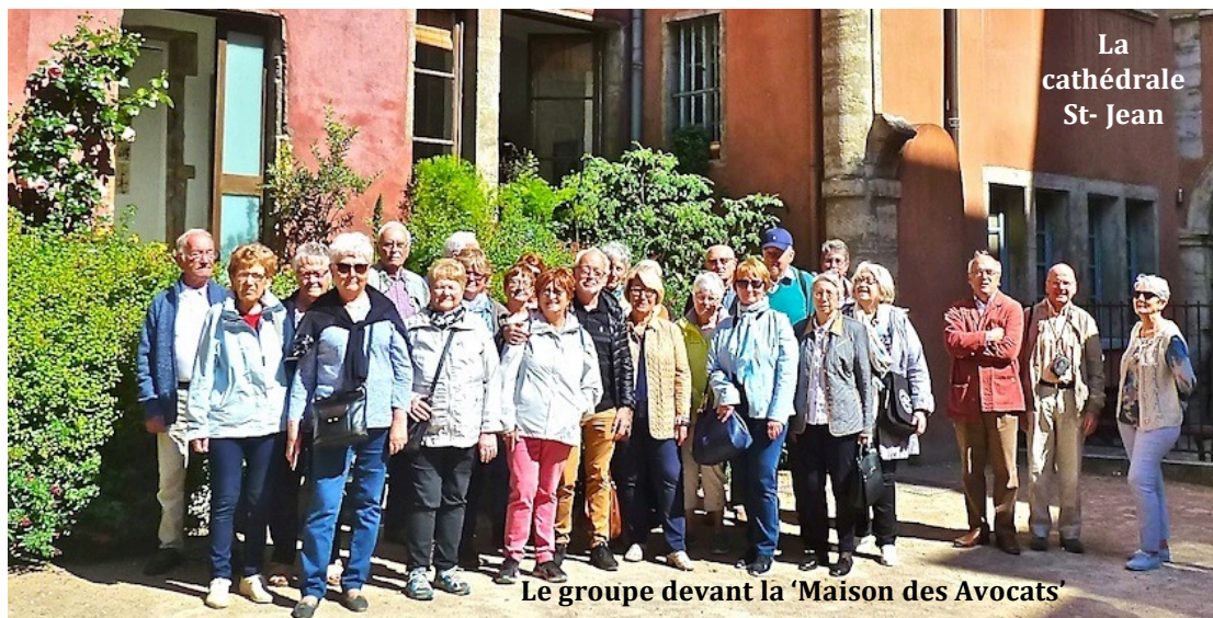
La cathédrale St- Jean

Nous traversons la place de la Basoche, cet espace public plus récent permet une vue sur la maison des Avocats.