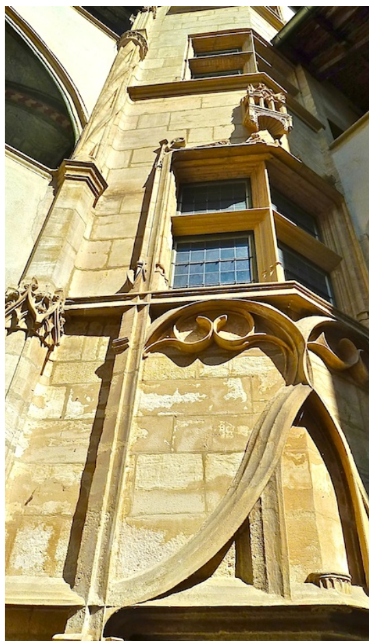
Une tour d'angle de cour intérieure

Nous empruntons encore plusieurs traboules mystérieuses ; dans ces couloirs étroits, les nombreux touristes croisent des restaurateurs, voire des résidents. Nous admirons les petites cours intérieures agréables et conservant un cachet du passé ; les escaliers d'accès à vis sont souvent abrités dans de belles tours rondes ou octogonales.