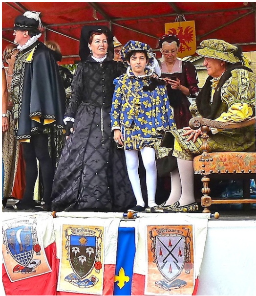
Catherine de Médicis & l'enfant Charles IX