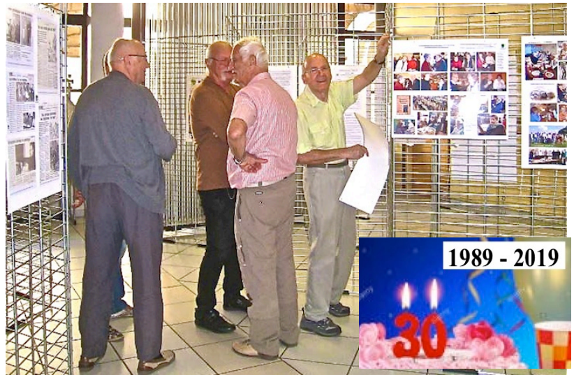
L'exposition 'les 30 ans du CGVVR'

Les éditeurs BLANCHARD FRERES, quatre générations d'imprimeurs, éditeurs et libraires à Vienne.