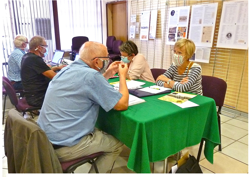
L'atelier généalogique : JEP, hôtel de ville Vienne 2020

Une cinquantaine d'associations et de clubs viennois étaient présents. Les allées furent clairsemées le matin, mais en revanche avec des nombreux visiteurs dans l'après-midi, lesquels se renseignaient voire s'inscrivaient dans les stands.