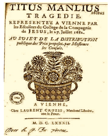
Représentation d'une tragédie donnée au Collège en 1682

L'exposition a été bien appréciée et notre aide généalogique a eu son franc succès habituel.