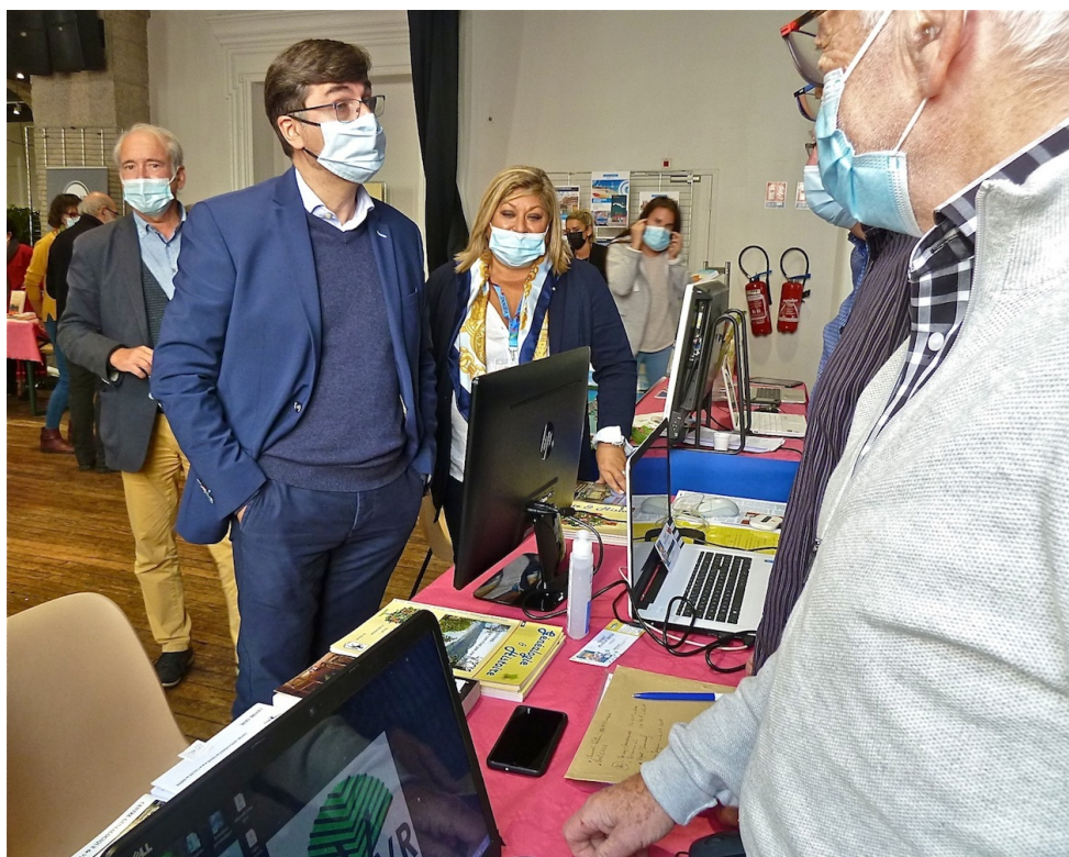
Salon des Seniors à Vienne : la visite de la municipalité à notre stand