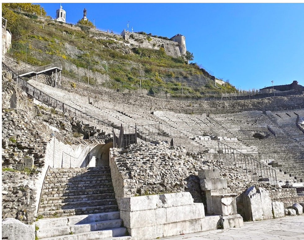
Le Théâtre antique de Vienne fut l'un des lieux de la visite de l'après midi de l'AG 2021

_ Sortie annuelle de juin 2021 annulée : la journée à St-Jean-en-Royans sera reproposée si la situation sanitaire le permet.