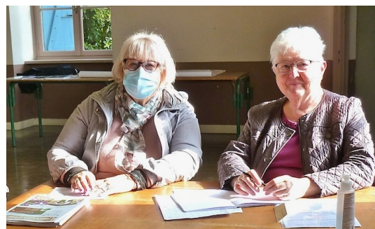
Les dames de l'émergement

Après la pandémie nous nous retrouvons afin de reprendre le déroulement normal de nos activités, avec une AG en début d'année, situation logique.