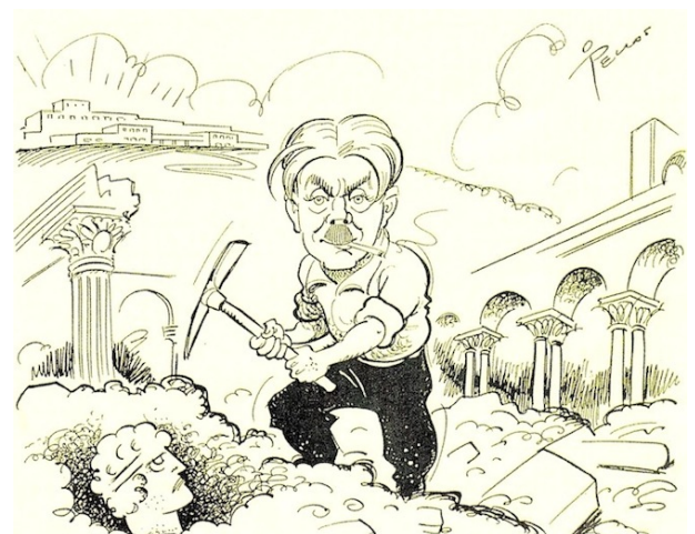
L. Husssel caricature de Pellos / archives CGVVR

Notre association participe habituellement à ces évènements.