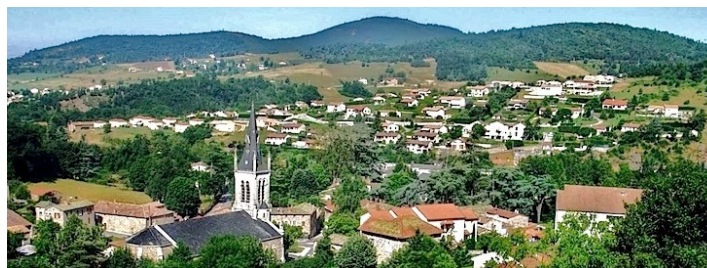
Le bourg de Saint-Marcel-lès-Annonay

Ils ont numérisé et annexé 5000 registres de notaires et Ils disposent de tables couvrant leur département.