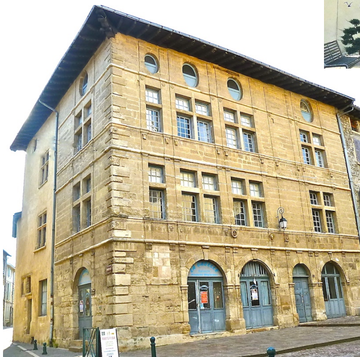
Tout près du salon du maître au 1 er étage, une double cloison était dissimulée permettant à des hommes de s'y glisser et d'écouter les conversations, prêts à intervenir.