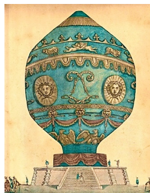
La montgolfière du survol parisien du 21 octobre 1783.