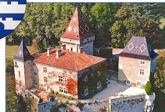
Le blason de la famille Murat et le château de la Sône dominant l'Isère