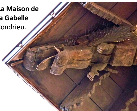
La chimère sculptée sous l'avancée du toit, l'animal fantastique de Condrieu !