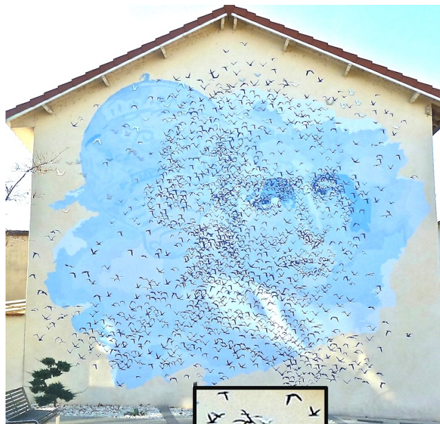
La fresque dédiée au marquis d'Arlandes à Anneyron et un aperçu du vol des oiseaux